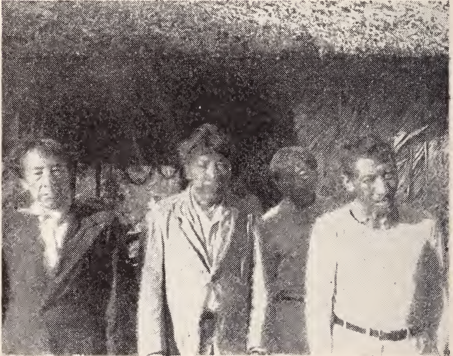
Guayo.- Tipos auténticos de indios guaraúnos.